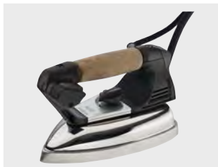
Парова праска (включена в базову комплектацію)